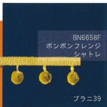
BN6658F ボンボンフレンジ シャトル