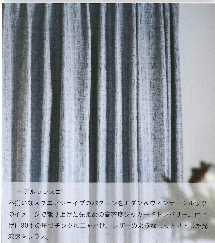
ーアルフレスコー

IH487-01~06 キャラバン (ベルギー製) 価格：¥7,800/m (¥5,650/m 2 ) 巾：138cm リピート：タテ 0cm ヨコ 0cm 組成：ポリエステル100% 200×200 ¥71,400 (3つ山2倍ヒダ)